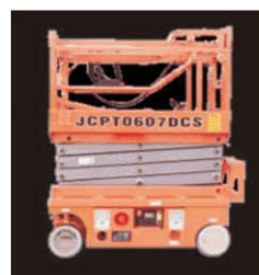
上部手すり格納時