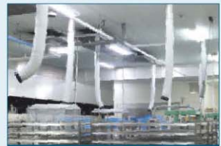
工場内冷房の様子