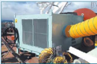
船上デッキへの設置状況