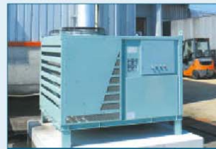
工場の建屋横への設置状況