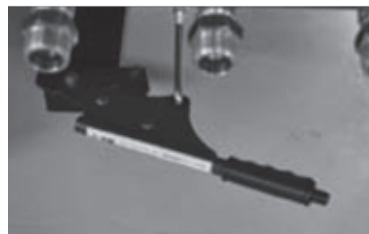
4輪トレーラには パーキングブレーキを標準装備